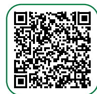
Live Online Seminar