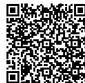
Live Online Seminar